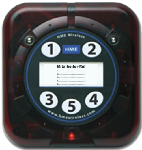
TableTop Rufstation 1, 3 oder 5 Ruftasten