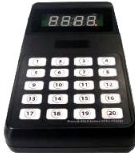
StarCall 20B Rufstation